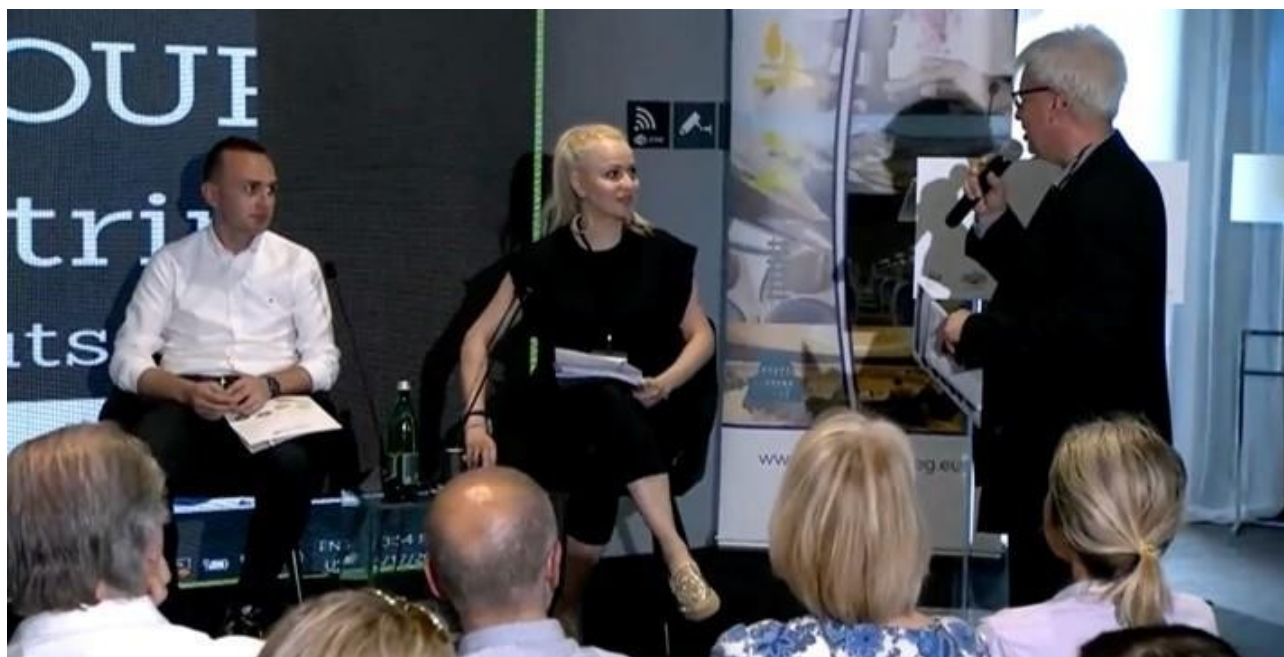
Slika 2: Predstavnici SUSTOURISMO projekta na godišnjem događaju ADRION-a, 2022

Projekat SUSTOURISMO je 17. maja 2022. godine predstavljen tokom godišnjeg događaja ADRION koji je održan u okviru 7. Foruma Strategije EU za Jadransko-jonski region (EUSAIR) u Tirani (Albanija). Predstavnici SUSTOURISMO projekta pridružili su se 'Panelu o pametnoj i održivoj mobilnosti doprinosu Interreg ADRION-a Zelenom dogovoru EU: Iskustva o obnovljivim izvorima & energetske efikasnosti i praksa zelene mobilnosti u Jadransko-jonskoj oblasti' i diskutovali o narednim koracima ADRION povezivanja i održivosti. Komisija je okupila predstavnike projekata kao što su Inter-Connect (PLUS), TRIBUTE, ENERMOb i SUSTOURISMO, koji su finansirani u okviru Interreg ADRION programa.