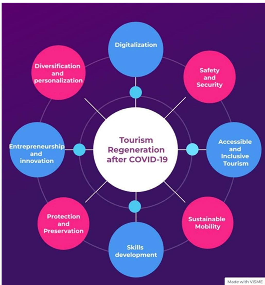
Slika 3: Prioriteti za oporavak turizma posle COVID-19 izvedeni iz zakonodavnog dokumenta pod-klastera

Za bliže informacije, zakonodavni dokument možete preuzeti na narednom linku: