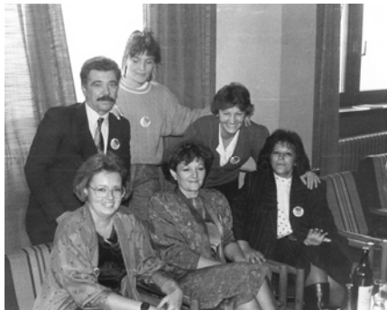
Зајослени у шtamпарији 1990-иe