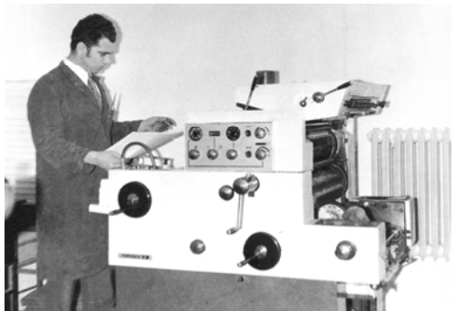
Лабораторија за графичко и фото множевање 1960-тих