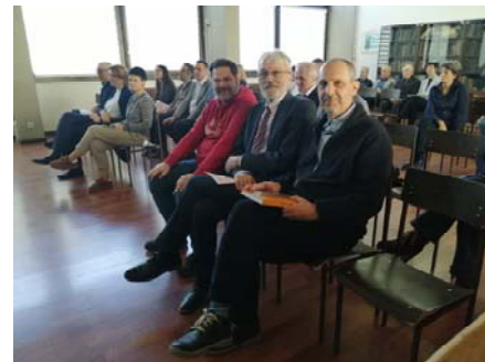
Свечана промоција издања њублицованих њоком 2025. њодине