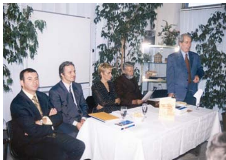
Промоција монографије „Модели за ујрављање колима железнице“, Сајам књиџа 2002. године