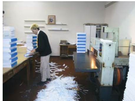
Шtamпарија Саобраћајног факултета 2002. године