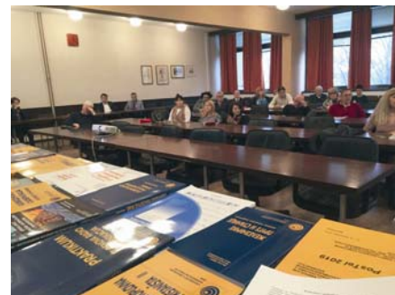
Свечана промоција издања